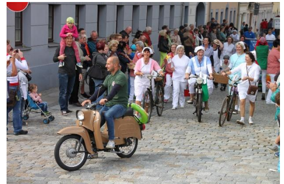
Soll es 2027 wieder einen Festumzug in Bischofswerda geben? Auch dies kann am 3. April besprochen werden.

Aufbauend auf den Erfahrungen der 790-Jahr-Feier in 2017 könnte das gesamte Jahr von und mit den Einwohnern und Freunden der Stadt gestaltet werden. Unter der Dachmarke „800 Jahre Bischofswerda“ könnten sich über das gesamte Jahr die Vereine, Institutionen, Unternehmen und natürlich die Stadtverwaltung einbringen. Die Veranstaltungen sollten unter anderem die Vielfalt der Vereinslandschaft in Bischofswerda zeigen, die Angebote der Veranstalter in den Fokus der Besucher rücken und damit mögliche neue Mitstreiter erreichen sowie Menschen, die sich sonst vielleicht nicht treffen würden, zusammenbringen.